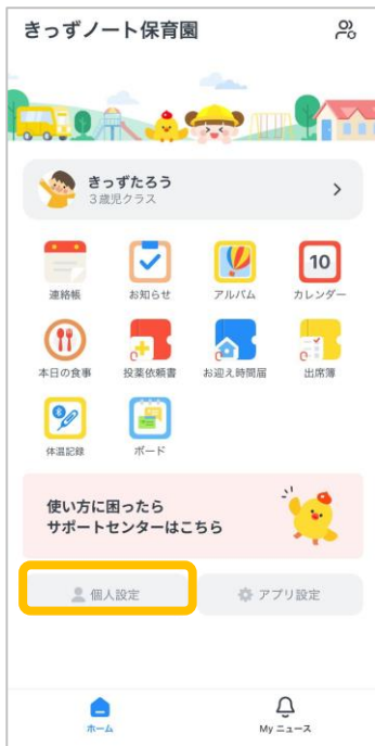
①「個人設定」をタップ