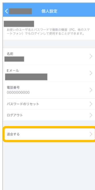
②「退会する」をタップ